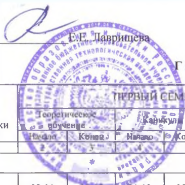
ГРАФИК УЧЕБНОГО ПРОЦЕССА НА 2018-2019 УЧЕБНЫЙ ГОД