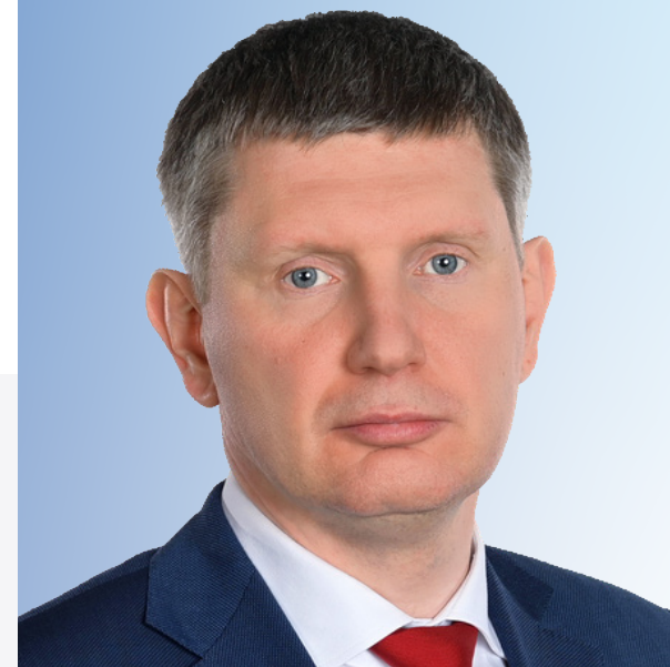
← Максим Решетников

Премия присуждается значимым инвестиционным проектам, выдающимся компаниям и личностям за их вклад в рост экономики и развитие инвестиционного потенциала регионов России.